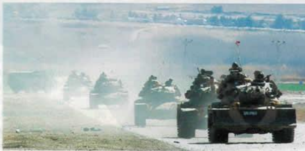
Türkisches Militär im Kurdengebiet: „Wir müssen uns wehren“

Gül: Es gibt sicherlich die unterschiedlichsten Wege, um mit dem Terrorismus fertig zu werden. Ich bin mir ganz sicher, dass unsere Experten auch schon den britischen Weg in Nordirland geprüft und analysiert haben.