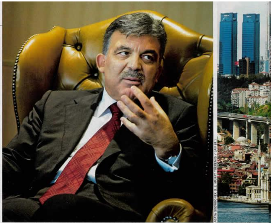
Präsident Gül, Wirtschaftsmetropole Istanbul: „Mein Land wird sich gewaltig verändern, Europa